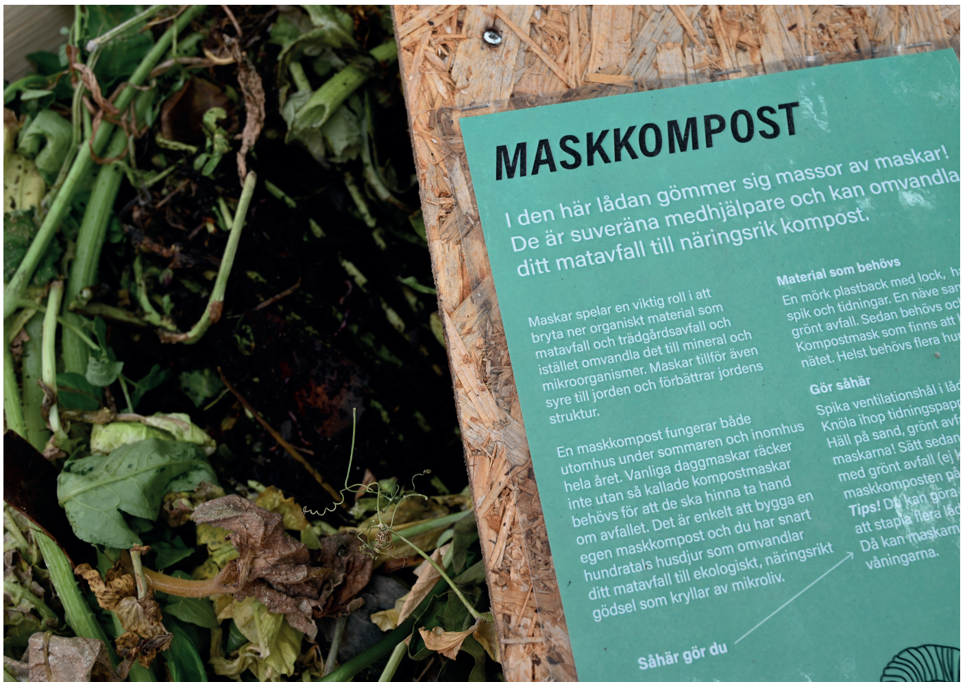
Informationstext, Bibliotek Garaget, Malmö.