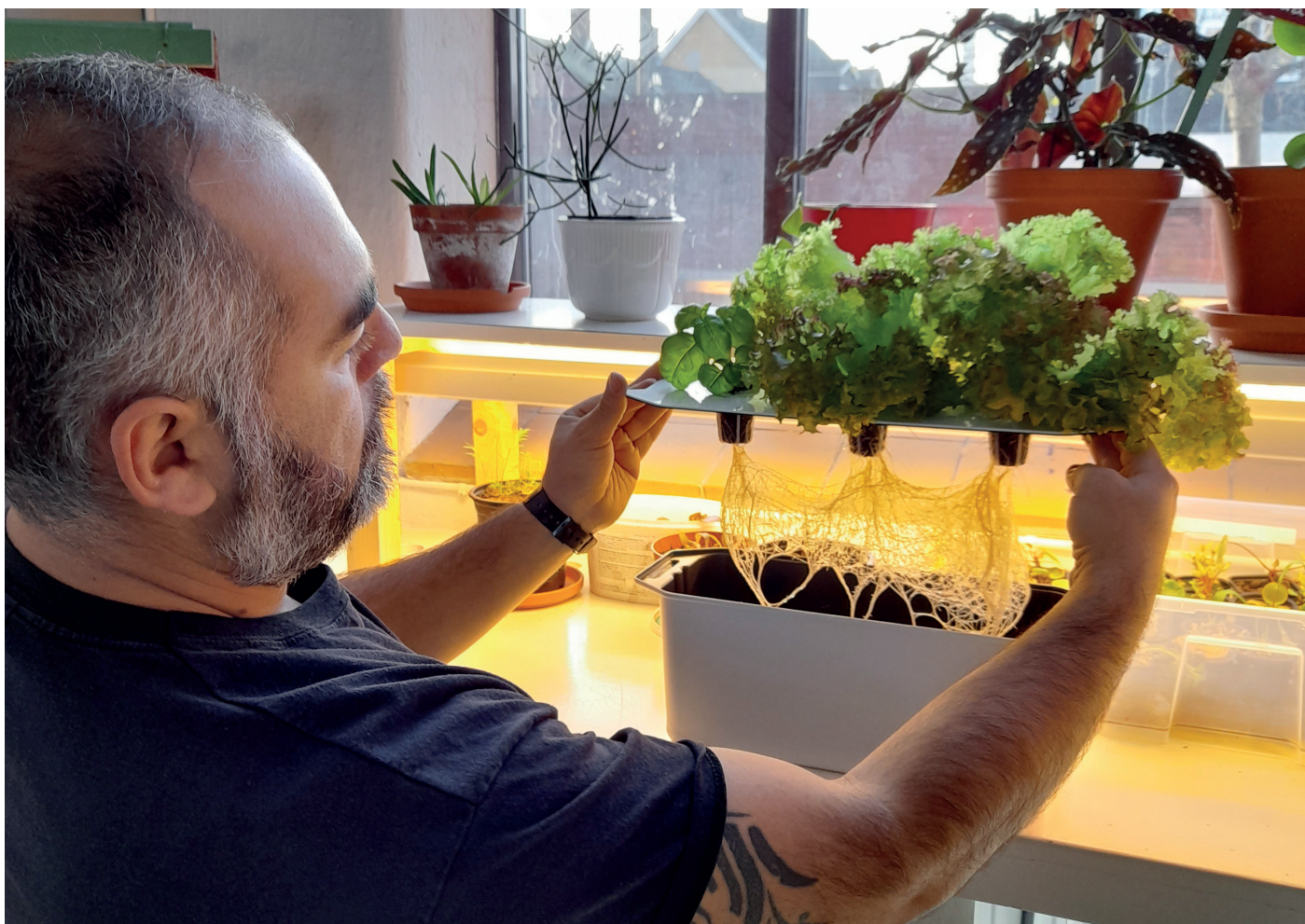
Hydroponisk odling, Bibliotek Garaget, Malmö.