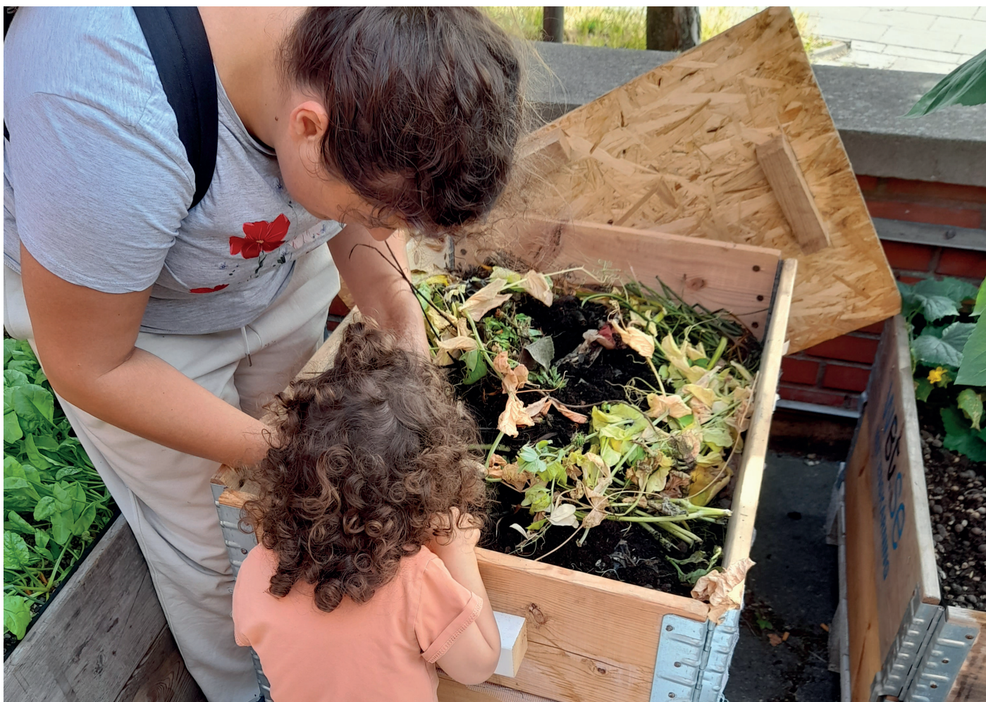
Bibliotekets besökare undersöker komposten, Bibliotek Garaget, Malmö.