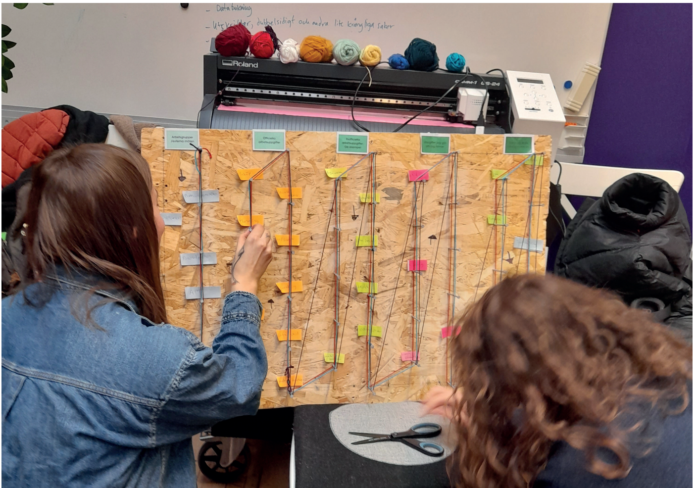
Kartläggning arbetsuppgifter, Bibliotek Garaget, Foto: Nicolas Keller

Efter dokumenteringen av arbetsuppgifterna visualiserades dessa grafiskt genom att de anställda fick markera sina arbetsmönster med hjälp av olikfärgade trådar. Syftet med kartläggningen var att skapa en överblick över befintliga arbetsstrukturer och identifiera områden i verksamheten där det finns möjlighet att integrera hållbarhetsarbete utan att arbetsbelastningen blir för tung för personalen.