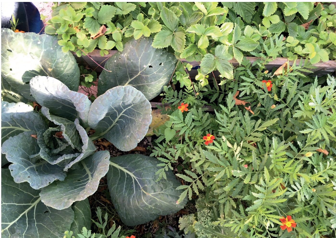
Grönsaksodling, Bibliotek Garaget, Malmö.