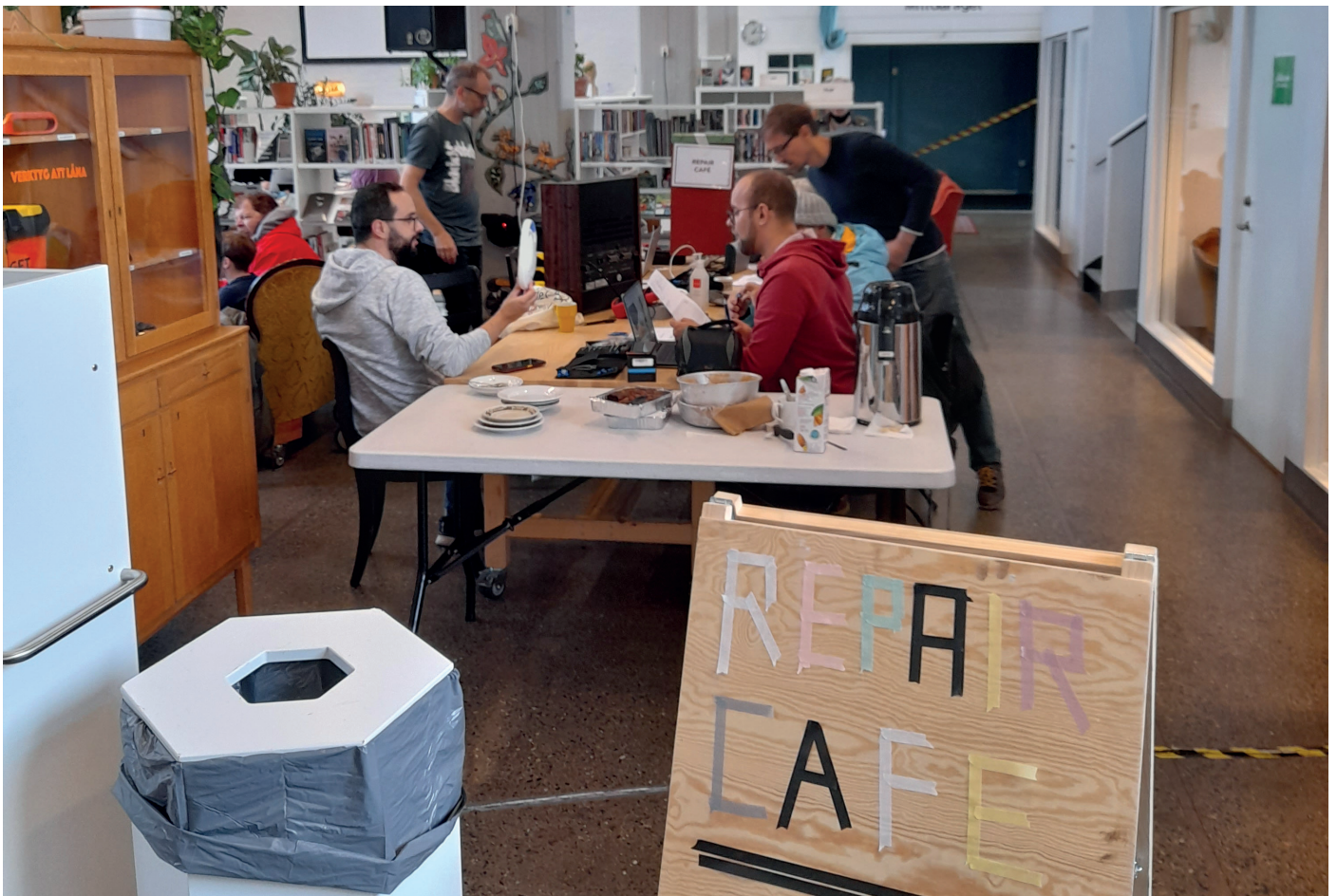
Repair café hjälper besökare laga sina egna elektroniska prylar, Bibliotek Garaget, Malmö.

Konceptet "Campfire & Science" tar forskare och andra tillsammans ut i naturen där forskaren avslappnat berättar om sina resultat. Kanske finns det en möjlighet för ett liknande koncept i biblioteket? Experimentera med egna format som tillåter att forskning och allmänheten kommer i kontakt under ett event som tillåter en avslappnad, öppen och familjär stämning. Varför inte kombinera det med en annan sorts aktivitet som exempelvis stickning, fika med mera.