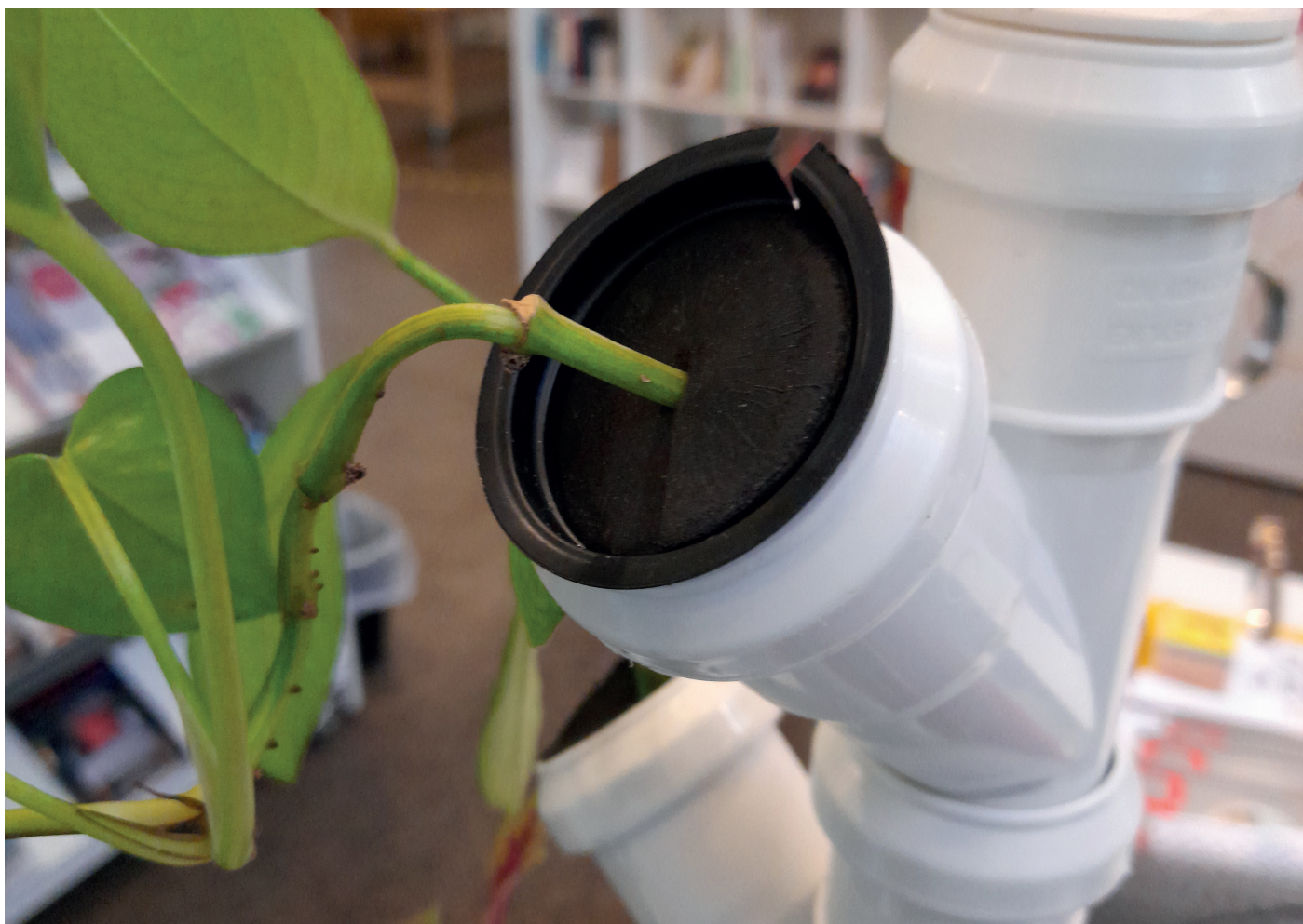
Hydroponisk odling, Bibliotek Garaget, Malmö.