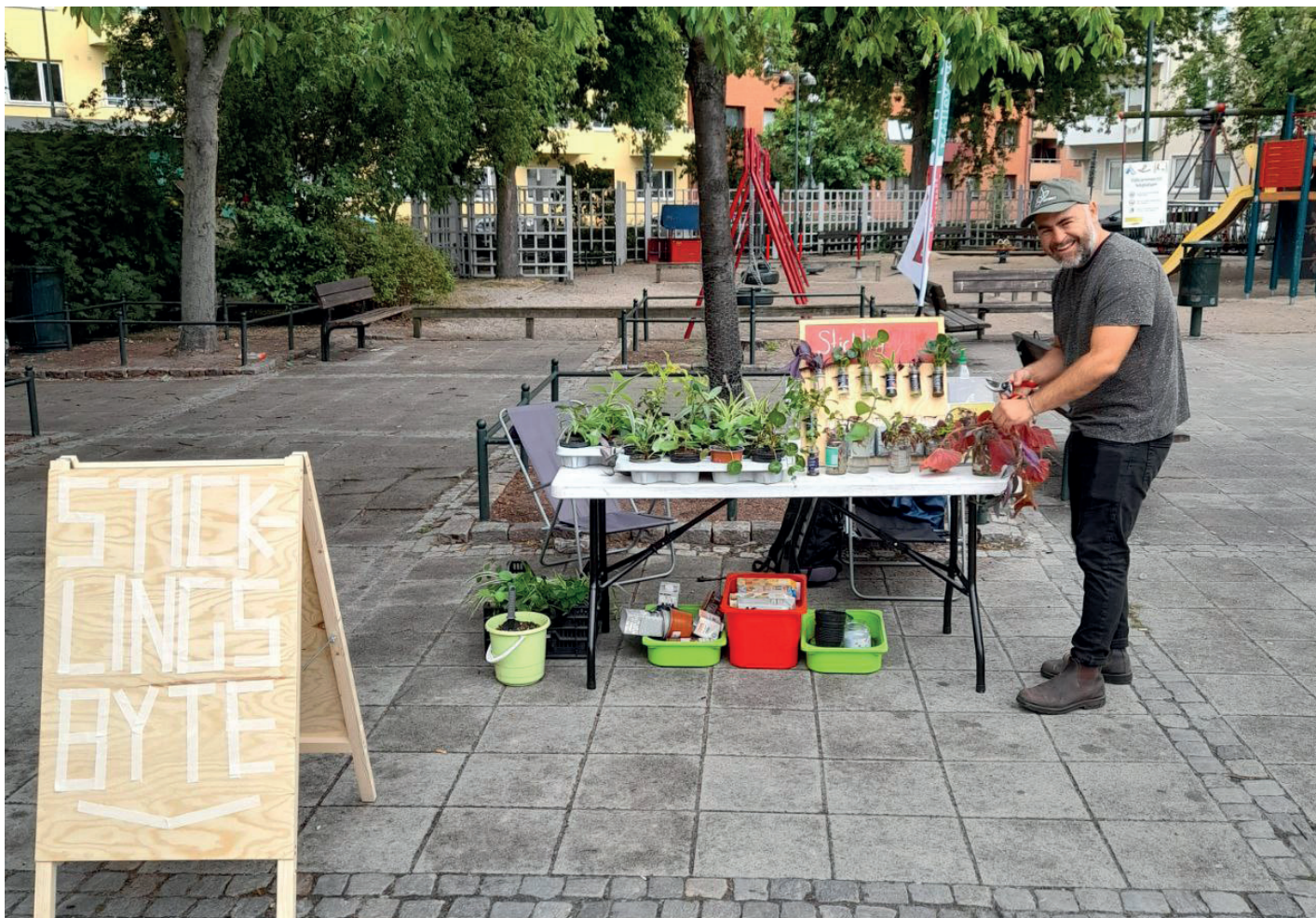
Att byta saker med varandra är ett enkelt och roligt sätt att minska sin konsumtion.