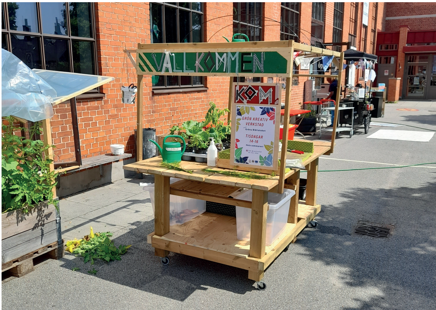
Mobil verkstadsbänk på hjul, Bibliotek Garaget, Malmö.