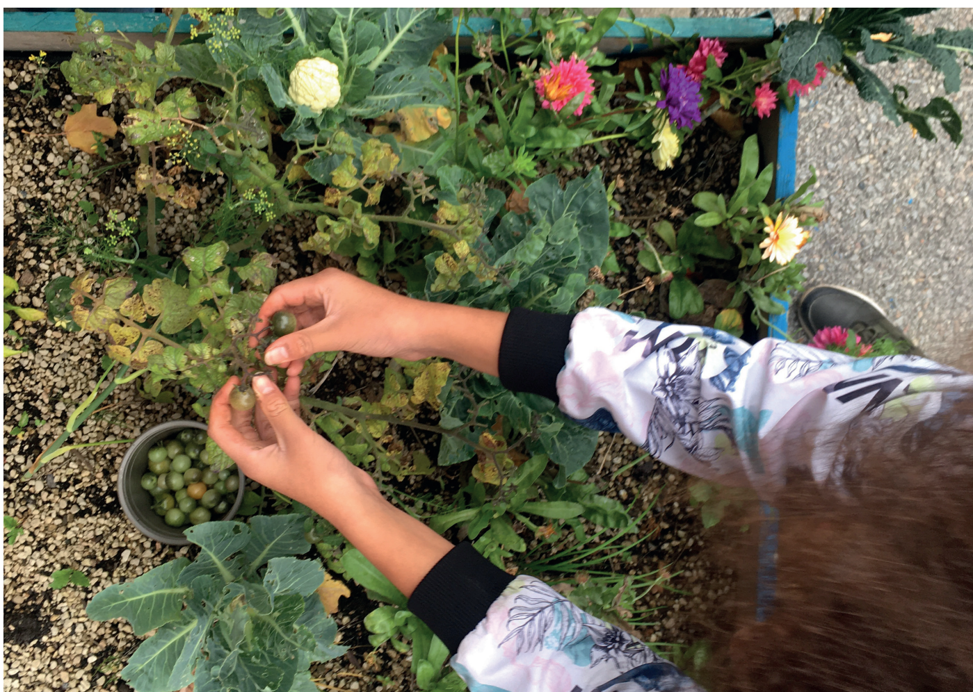
Grönsaksodling, Bibliotek Garaget, Malmö.