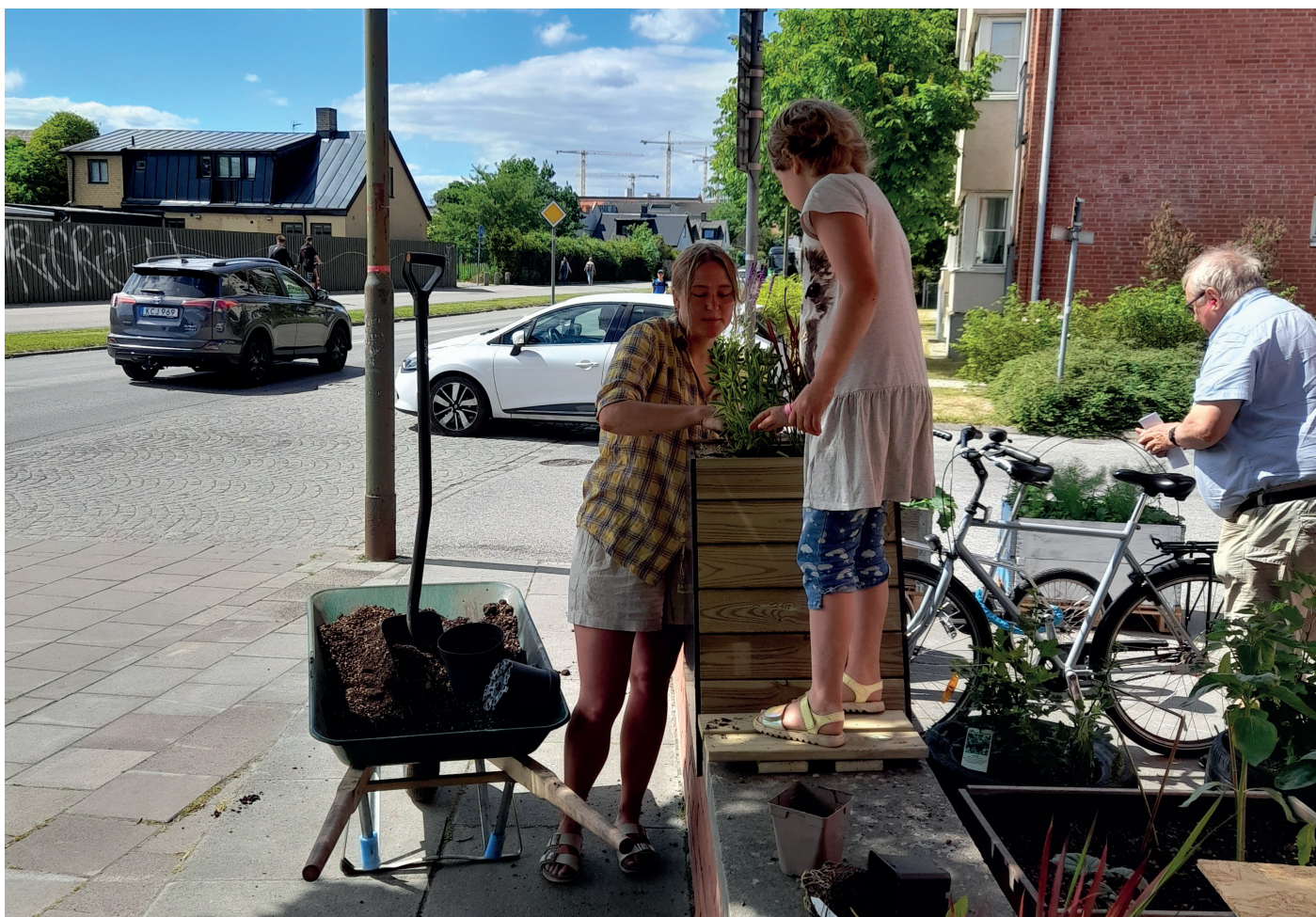
Odlingsverkstad, Bibliotek Garaget, Malmö.