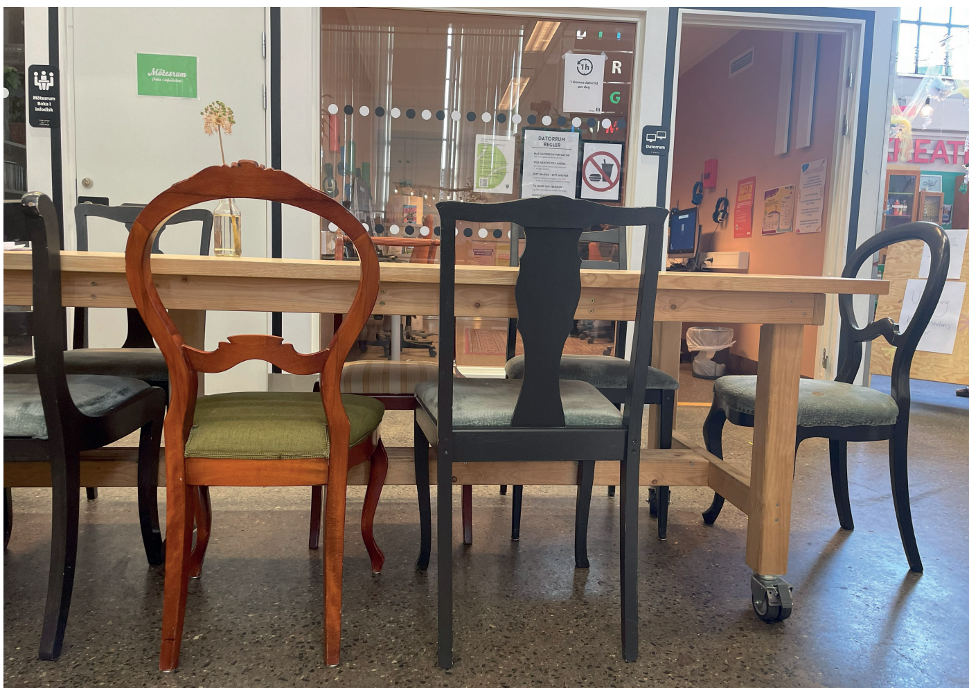
På Bibliotek Garaget i Malmö är många av möblerna återbruk och inköpta i andra hand istället för att köpa nytt.