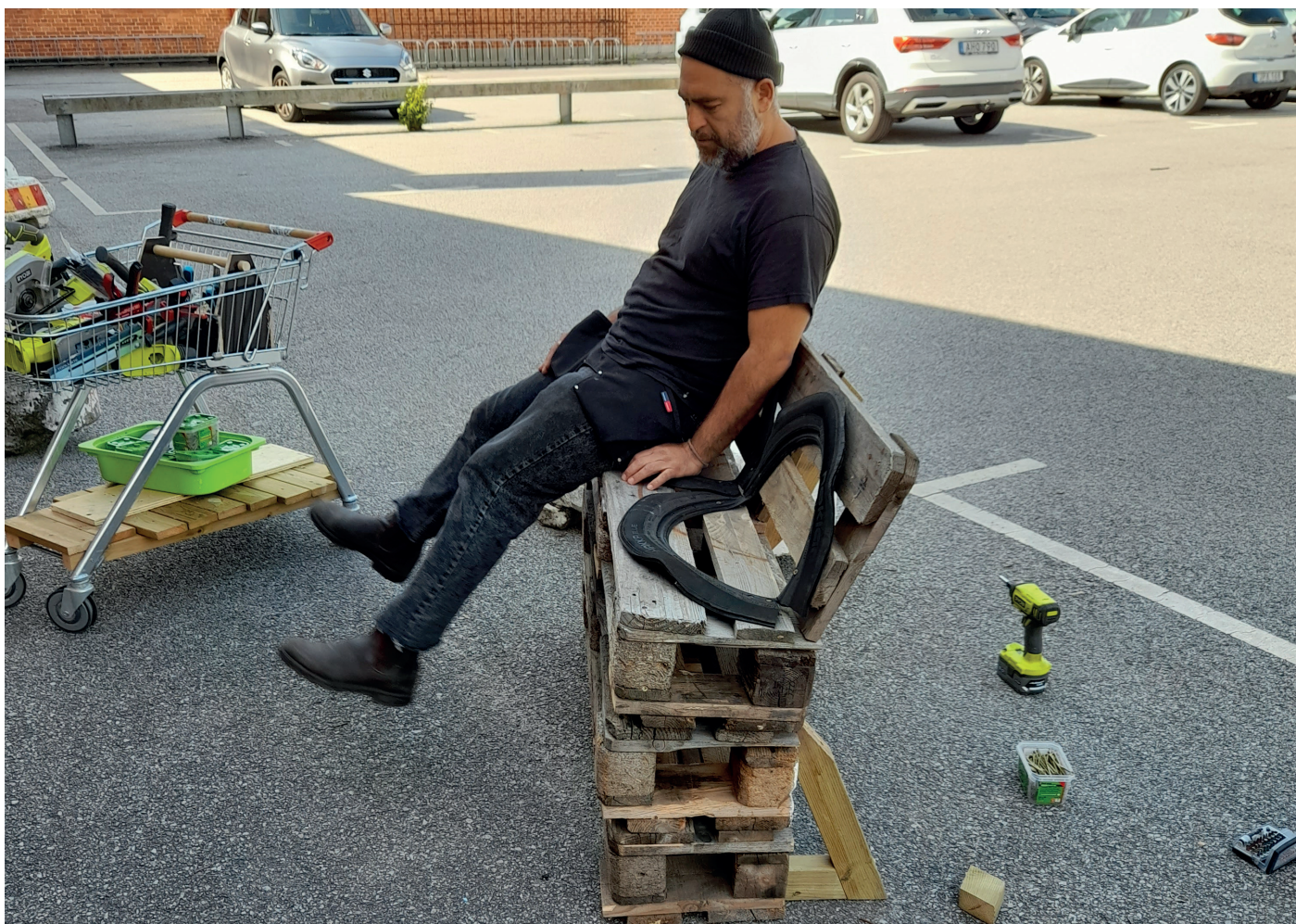
Möbelbygge av gamla EU-pallar och bildäck, Bibliotek Garaget, Malmö.