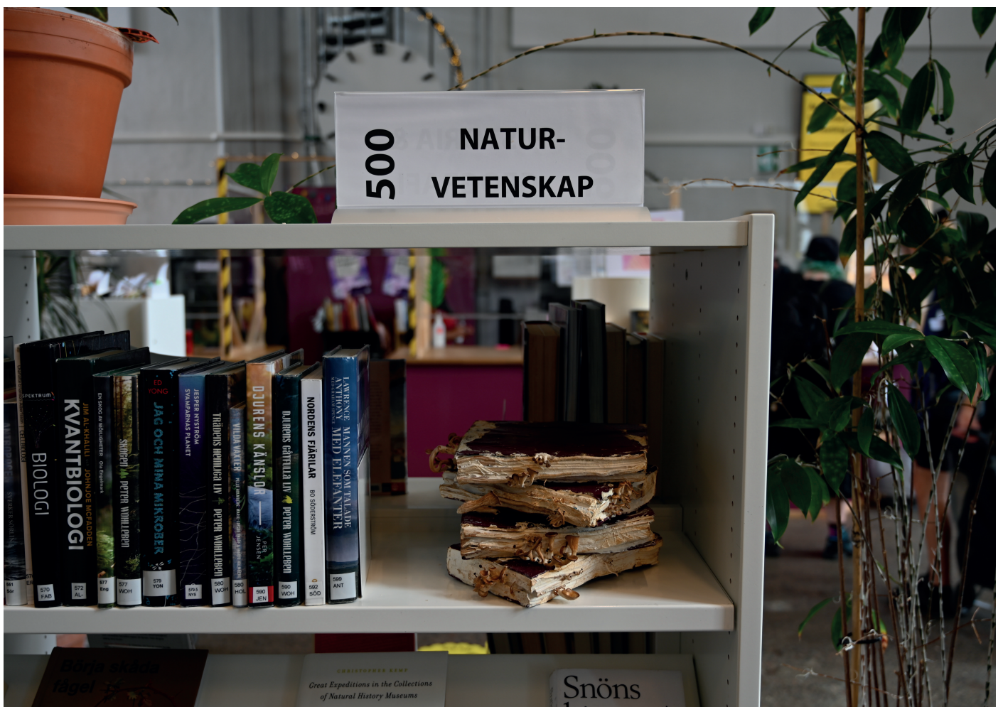
Litteratur och svampodling i gamla böcker, Bibliotek Garaget, Malmö.